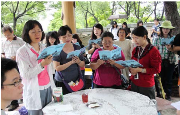
戶外相調主日擘餅