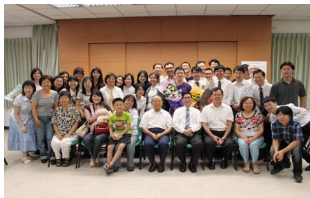
畢業生愛筵後大合照