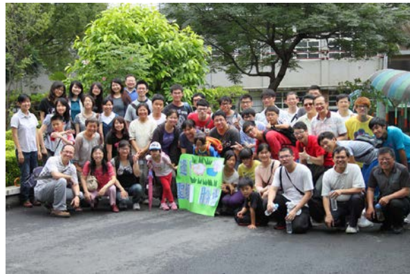
大區新人戶外相調