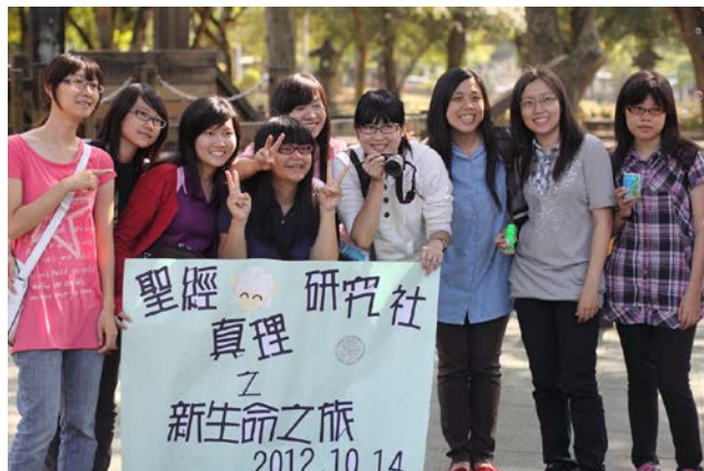
逢甲社團迎新相調