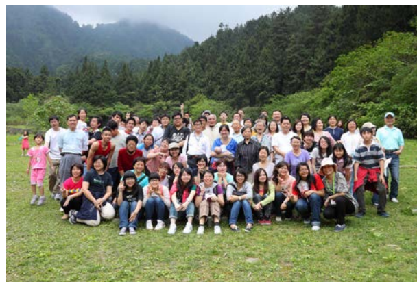
大專迎新戶外相調