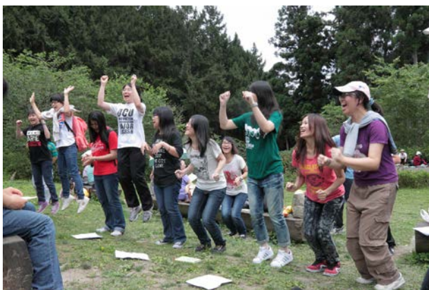
團康活動回轉像小孩