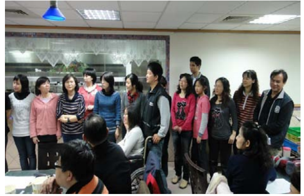
「五二五青年福音聚會」聖徒在一裏配搭