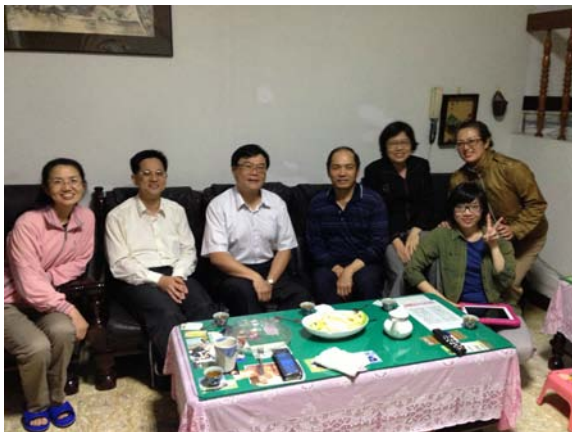
與壯年班學員一起家訪