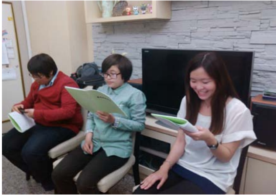
聖徒打開家與嶺東科大的學生有個甜美的相調