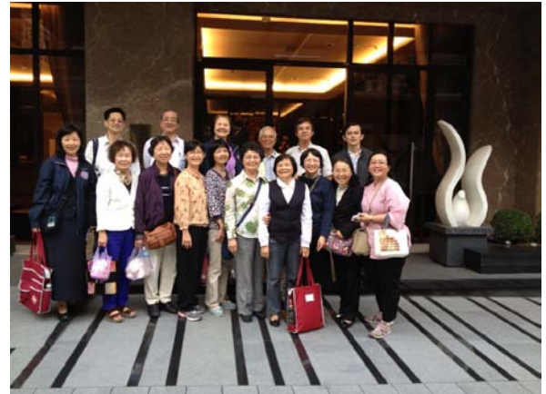
大區聖徒與壯年班學員一起出外傳福音