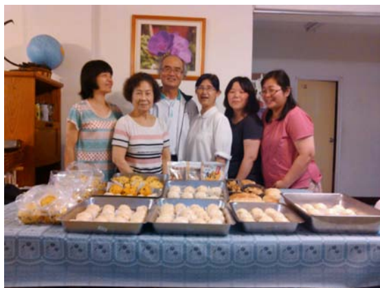
與剛得救的新人一起做包子相調