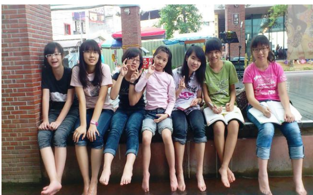
青少年宜蘭相調一湯圍溝