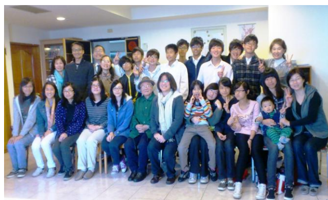
青少年的主日聚會