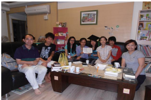
中山醫大在聖徒家中的讀經小組