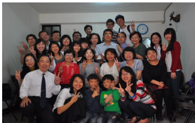
中山醫大姊妹之家開區