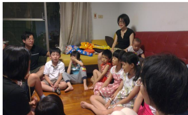
兒童排一兒童認真操練禱告