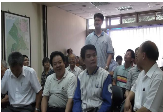
大甲小區主日申言