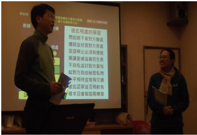
造就聚會夫婦見證