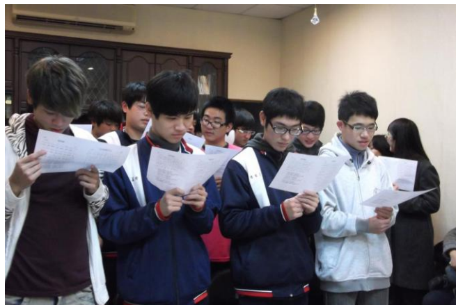
大甲高中福音聚會