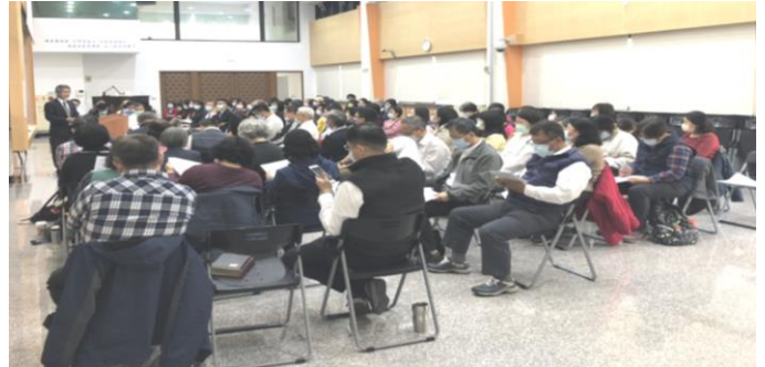
半年訓練的現場訓練於豐原會所

北二照顧區美地的境界幅員遼闊、廣大，最東至和平區的梨山，最西至大雅區的清泉崗接近海線。由東至西，包含和平、東勢、石岡、后里、豐原、神岡、大雅…等九個行政區。面積約佔台中市的六成；人口 46 萬，約佔台中市的 16%。