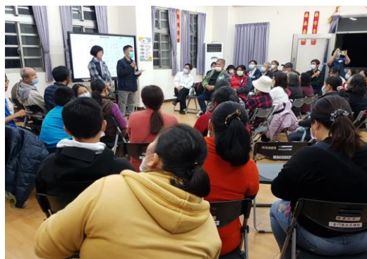
金沙鎮首次福音聚會