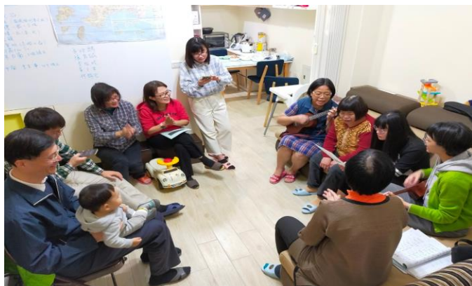
聖徒與鄰居一同唱詩禱告