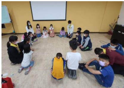
活動「就」—奉獻爭戰禱告

這是我們第一次參加親子園，很受兒童排見證的激勵，真是成為我們開排的鼓勵。我們預計在月底新開一個幼幼排，為着家中的兩個小孩，也為着同照顧區的小小孩。感謝主，能讓我們聽到這些見證，讓我更清楚可以如何帶領孩子進入屬於他們自己的聚集。求主更多的賜福給所有的孩子，使我們能有更多的禱告，為着家中的家庭時光以及兒童排。