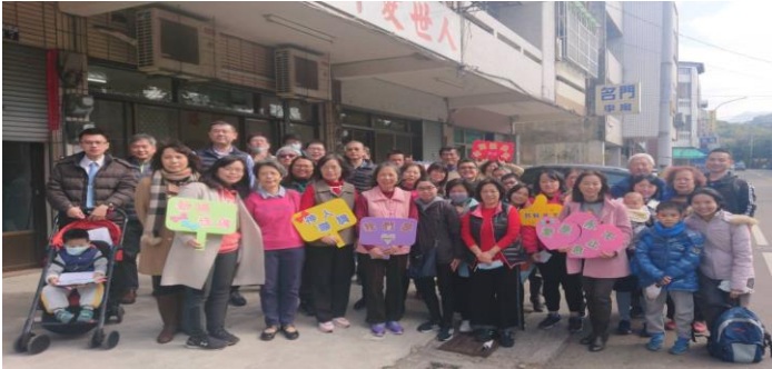
十九、三十八大區元旦至東勢會所與三十一大區相調

從現在起，眾召會該經常來在一起相調。我們也許不習慣，但我們開始相調幾次以後，就會嘗到那個味道。在保守基督宇宙身體的一上，這是最有幫助的。（神聖奧秘的範圍，第六章。）