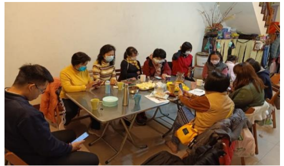
青職暨社區排聚集

在會所，有學齡兒童的兒童排，主要有三個家及社區聖徒共同服事，邀約公園福音接觸的對象、鄰舍、同學及聖徒的兒童，讓小孩子到主面前來。另外還有幼幼排的聚集，每週五晚上在聖徒家中聚會，由三個家輪流服事。有青職聖徒前來配搭，也有兩個福音家經常與我們相調，一同有分。感謝主，在兒童工作上，主帶領我們走新路，有分於復活升天之基督的繁殖與擴增。