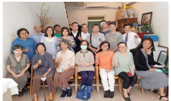
陳平小區聖徒合影