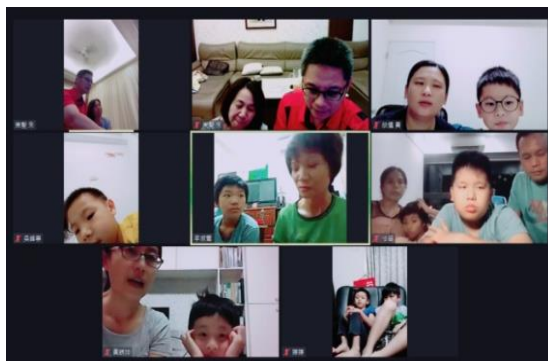
疫情期間鼓勵孩子邀同學、鄰居參加線上兒童排

不管疫情如何，我們不要看環境，只需要順從在我們裏面運行的神。還記得我們製作第二部影片時，我對兒子說，為甚麼我們的影片只有二十幾次的點閱呢？心裏覺得不想拍了。但兒子對我說，你原本牧養三個孩子，現在至少有三個以上的孩子在看影片，這樣你就牧養六個人。哇！我頓時被激勵了，高喊阿利路亞！許多姊妹告訴我，他們的孩子藉着看我們兒童排影片，就一起有操練，也得着牧養。兒子的老師、同學藉着看影片也認識了我們奇妙的神。感謝主，願榮耀歸與神。歡迎弟兄姊妹帶着孩子一同觀賞我們的影片，YouTube 搜尋「線上兒童排」。