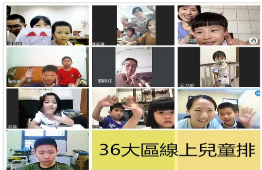
疫情之下喜樂的線上兒童排

最近因着疫情嚴峻，雖然五月份的公園福音暫停，但感謝主，使我們藉着羣組能持續關心、牧養孩子和家長。並藉着 Zoom 仍然有週五及週六的線上兒童排，許多已過因距離無法參加實體兒童排的家，現在能不受空間限制的上線參加，真是喜樂。現在學校、公園雖不能去，但是兒童排可以一直持續！感謝讚美主，主永遠為我們開路！