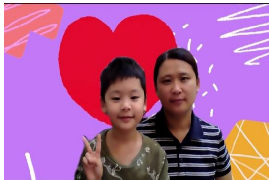
媽媽陪伴孩子一同製作的福音影片