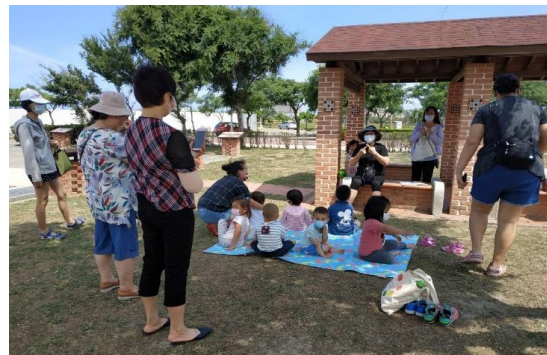
疫情前週週兒童公園福音

直到去年召會推動公園福音，並鼓勵聖徒們從「來」轉到「去」，從「會」轉到「人」，以及神主宰下的疫情環境，從三月份開始，我們將媽寶排從會所改到社區公園聚集，開始了每週四的公園福音。每次都吸引孩童和家長參加，有些孩童和家長幾乎週週參加，甚至建議我們貼一張聚會時間的公告。還有在北部聚會的姊妹，帶着住梧棲的孫子來參加。隨着配搭服事的聖徒增加，聚集人數穩定在十三到十五位。會後我們也主動接觸家長，反應好的就邀請加入羣組。