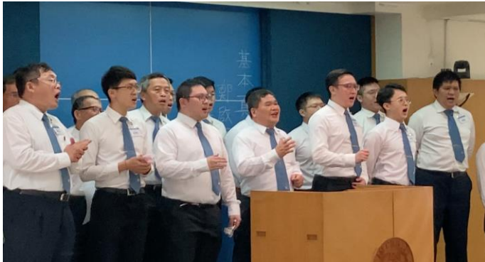
學員練唱結業詩歌—作得勝者，此志不移

台中市召會開展成全班，為配合增區開展計畫，積極成全召會中有奉獻心願者，接受各方面裝備，好成為召會中的柱子，肯承擔託付、背負責任；並實行神命定之路，在福、家、排、區的架構上加強生、養、教、建的操練，以達到召會擴增的目標。以下為六月十二日夏季結業聚會中，學員所作【成全將我變化】的蒙恩見證；願我們同受激勵，有分這榮耀的行列。