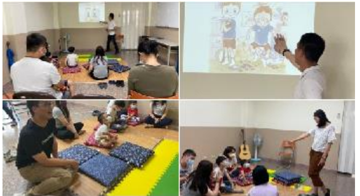
學員與聖徒一同配搭兒童排

三十四大區在今年三月二十九日到五月二日申請了全時間訓練學員的開展隊前來。學員在公園開了一個福音兒童排，在公園裏有家長和兒童來參加，可是帶不到會所裏。後來學員們就調整，直接在會所開一個兒童排。起先還擔心會沒有甚麼人來，結果第一次就來了三個福音家！當天共有六個兒童和他們的家長，讓我們大得鼓勵。之後，兒童排陸續有三位媽媽受浸，所以兒童真是一個大的福音。