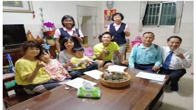
學員在各大區實行出外探訪、送會到家