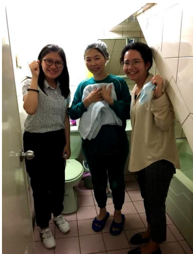
因為兒童排得救的姊妹