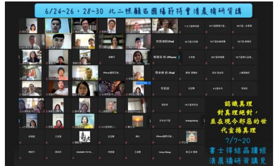
北二照顧區線上國殤節特會清晨禱研背講 共約一百位聖徒參與

以下為一位姊妹的蒙恩：「我剛開始參加時，不習慣晨間上線開視訊禱研背講，所以躺在床上用聽的。但聽到弟兄們很認真、清楚的帶領我們進入綱要，帶大家操練講說，我越聽越享受，也跟著練習講。我感覺不能再繼續躺在床上，就坐到書桌前，跟大家一起進入。之後每天早晨，我早早就豫備好，期待着上線，進入當天的禱研背講，非常得着供應。」