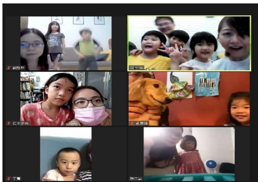
孩子們一同喜樂的交通

自從五月中疫情爆發以來，我們改成線上聚會。雖然一開始，孩子不太適應新的方式，但我們鼓勵孩子：「無論如何，都不可以放棄我們的聚集。我們一樣有詩歌、故事和經節，一起享受主的豐富。」慢慢地，孩子也習慣線上聚會，和我一起為那些因功課太多、交通受限而無法來的同伴們禱告，禱告完，由孩子自己打電話邀約。