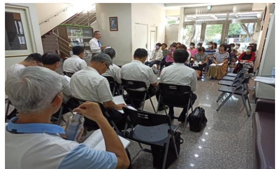
已往清晨禱研背講於豐原會所