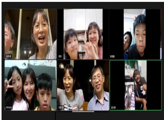
線上聚集使更多家一同有分基督豐富

一位久未聚會的四年級孩子就因此出現在線上兒童排，恢復與我們的聯結。一個家已經一年未參加兒童排，當他們知道有線上兒童排後，週週都與我們在線上歡聚。另一個家也很想參與，因家長晚下班且遠在彰化，這兩週便提早進入線上兒童排。這是一個非常特別的時期，然而我們在雲端上的聚集，使主不受限制，藉各種方式湧流到我們裏面。在這六週的線上兒童排中，兒童家長與青職、社區聖徒忠信的輪流講故事、帶詩歌；好些服事者、家長還帶職服事。看到許多家這麼盡力堅持參加兒童排，我裏面深受感動。有誰像孩子們一樣，這麼期盼參加他們自己的聚集、如此渴慕見同伴們的面？雖然目前還等不到解封，但我們願意一日在此，一日堅持；藉着線上兒童排，使主生命的話進到更多家中，家家蒙聖別。