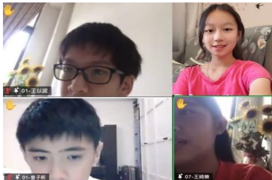
小六國一生命成長園合照

因着堅定持續的晚禱，使我更被穩固；跌倒時，有他拉我一把。我們週週晚禱，一起享受主的話，互相關心近況、代禱，至今已經有三個月的時間了。有同伴一同追求基督，實在是美好。我們並沒有因着疫情放棄我們的聚集，反倒運用科技，在家餵養、顧惜人，不受時間和空間的限制。