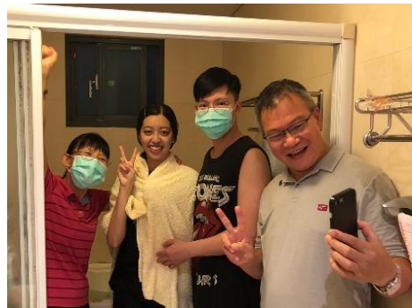
疫情期間帶家人得救

二十五大區於今年一月繁增出四十一大區，目前約有五十六人。增大區後，弟兄們尋求如何穩固聖徒的召會生活，並加強青職的牧養。當五月線上聚會開始實施後，負責弟兄們加緊學習，帶領聖徒們一同操作線上聚會，並週週電話關心聖徒，使線上主日人數能維持在基數左右。以大業小區為例，聖徒們週間關心彼此、邀約小排與禱告聚會；早晨操練一同上線晨興；主日聚會鼓勵聖徒申言，使眾人得着供應。會中，弟兄們積極傳輸召會的負擔，使聖徒們跟上水流，在疫情期間積極把握機會，餵養未得救的家人。因着主的帶領，有聖徒將家人帶進神的國，並將受浸過程直播出來，使弟兄姊妹一同有分，同心合意禱告、讚美神。