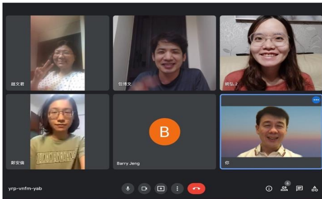
二十六區青職排線上聚集

從去年十一月，我們在週六開始了青職排，雖然大家都喜歡到各家相調，但因對主話的享受有限，小排的人數一直無法繁增。從今年五月開始，我們改為線上聚會，因着線上聚會的方便性，弟兄姊妹更踴躍地參與；追求的信息濃縮後，弟兄姊妹更進入對主話的享受！目前，每週六約有七至八位的青職聖徒，一同在線上小排，非常喜樂！八月的青職特會，因着疫情的緩解，青職聖徒也再次聚集到社區聖徒的家中，一同進入特會信息，並在中午用餐時分享，滿了召會生活的實際！願主祝福二十六區的青職聖徒，越過越愛主、越過越火熱，將自己奉獻給主！