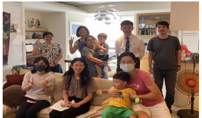
青職特會期間在聖徒家中相調