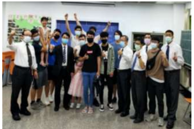
照顧區實體福音聚會

隨着疫情的緩解及召會的帶領，中三照顧區各大區漸漸恢復實體的聚會。實體聚會中，聖徒們不再受限於線上聚集的一些限制，而能自由地釋放靈。不論是在禱告聚會、小排聚會或是主日聚會等，弟兄姊妹都更珍惜、享受我們自己的聚集。此外，在九月份，各大區也開始恢復月月的實體福音聚會。疫情期間，弟兄姊妹們週週題名禱告，加強聖徒福音的靈。現在既恢復實體聚會，大家就把握機會，利用週末開展的時間，邀約尚未得救的親朋好友前來