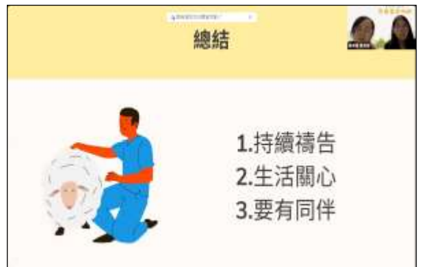
僑光大專生分享活力排實行

有聖徒見證，在這三、四個月的活力排操練中，他們的進步超過已過數十年所過的召會生活。目前約有二十個活力組，在活力排中，弟兄姊妹們有同伴扶持，有追求享受，並有名單代禱。藉着與活力同伴相調、追求、代禱，生發出對人真實的負擔，接觸尚未得救的親屬密友、福音朋友，並餵養新人及久不聚會的弟兄姊妹。