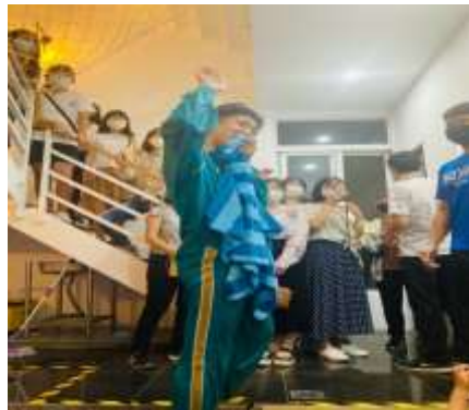
主將青年人加給祂的召會