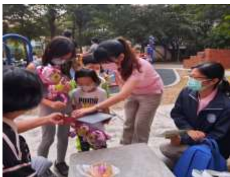
公園兒童福音配搭