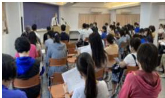
青少年服事者交通

召會要繁增，在於我們認識自己是「新約福音祭司」，帶領罪人歸神是我們的天職。我們都當起來作勤奮的祭司，勝過死沉、不冷不熱，不結果子這三大仇敵，成為為主恢復擴增迫切的人。我們當在青少年中間興起活力人，走神命定之路，產生得勝者。以下是五點得青少年的實行：