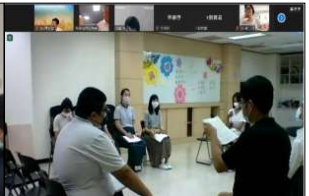
實體、線上聚會並行