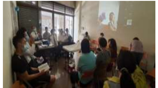
扶持青職週週家聚會