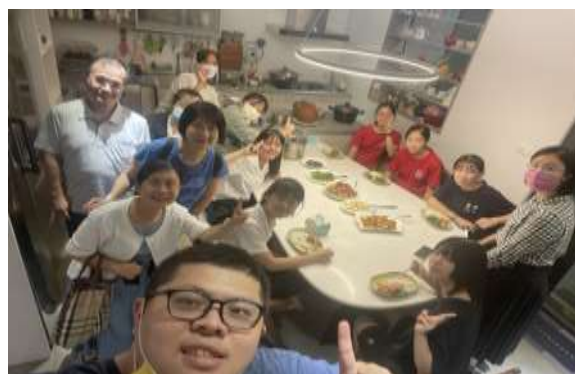
文華高中校園排結果子