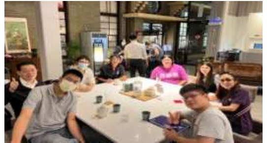
全區齊心進入福音成全

其間，弟兄們推行人人都有晨、晚興的負擔，幫助人人找着同伴、實行家聚會，建立彼此牧養的關係。藉此，週二禱告聚會的人數，也由原有的六位翻倍增加。近來因召會推行福音成全的負擔，福音出訪人位也突破主日人數的三分之一。感謝主，當聖徒們對主的享受被拔高，並達到同心合意，召會生活就滿有主的祝福。