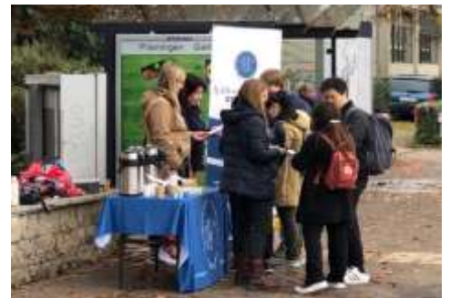
在霍亨海姆大學擺攤，藉着熱茶和咖啡與學生有福音的談話，尋找平安之子。