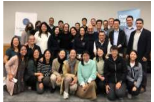
抵達斯圖加特的第一天晚上，與來自各地的聖徒一同有分福音開展的交通與禱告。

我們不僅在校園中接觸新生，也到車站、商場旁發送免費恢復本聖經，一句「Kostenlose Bibel！」（「免費聖經！」）讓不少當地人停下腳步。我們喜樂地與人們分享這本解開的聖經，陳明其屬靈的豐富，不論是綱要或註解都叫當地人眼睛一亮，樂意領本聖經回家享受！（未完待續）