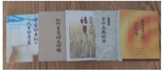
堅定持續追求過的書報

二十一大區聖徒從二〇二一年八月二十六日開始，每週四晚上八點到九點用 Line 一同追求屬靈書報。至今已經超過一年，每次都有十多位弟兄姊妹上線。我們操練用靈讀，一個小時下來，常被聖靈充滿。我們要分享其中所讀過的書報：