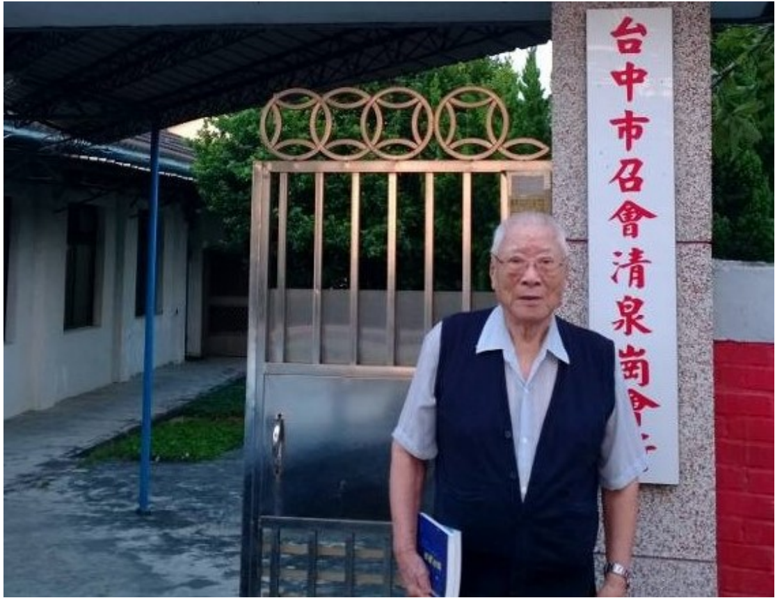
■經過一個甲子，郭弟兄仍忠信為在主的恢復中，作主耶穌活的見證人。